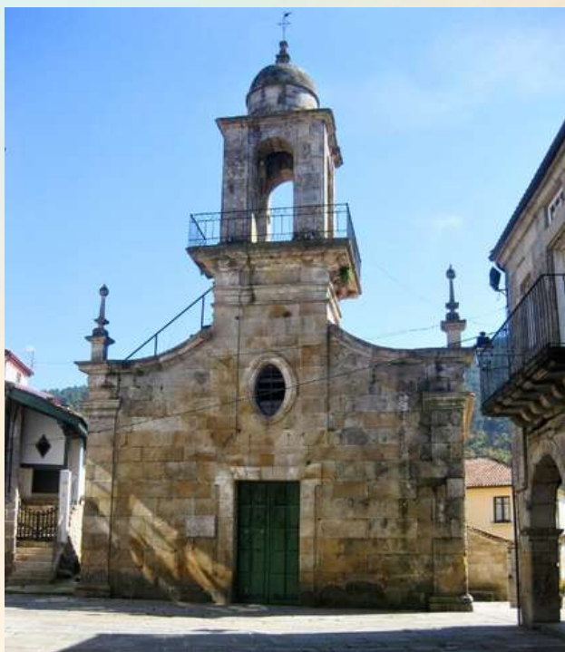
Igrexa Da Madelena Praza da Madalena 2, 32400 Casco histórico de Ribadavia